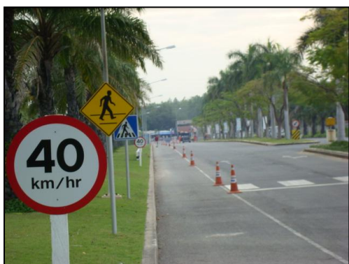
รูปที่ 3-29 ป้ายจำกัดความเร็ว บริเวณอาคารสำนักงาน