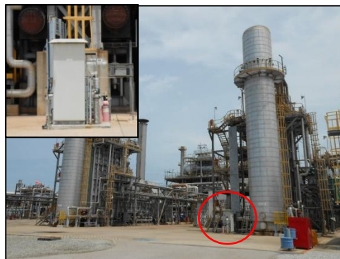
รูปที่ 3-12 CEMS ของปล่อง HRSG

ภาพถ่ายประกอบการปฏิบัติตามมาตรการป้องกันและแก้ไขผลกระทบสิ่งแวดล้อม