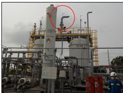
รูปที่ 3-20 Outlet ของ VRU