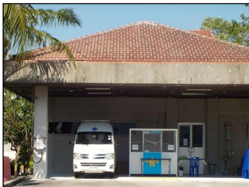
รูปที่ 3-33 รถพยาบาล