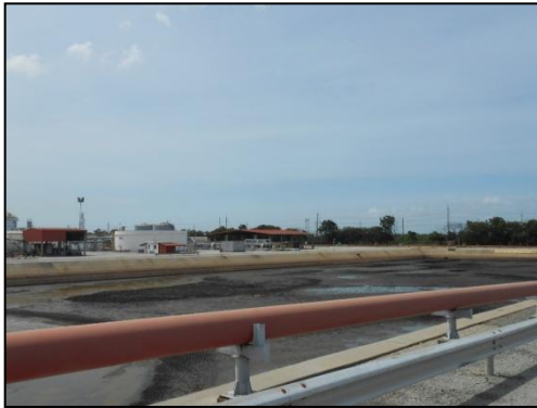
บ่อรวบรวมน้ำฝนที่มีโอกาสปนเปื้อน (Potentially Contaminated Storm Water Holding Pond)