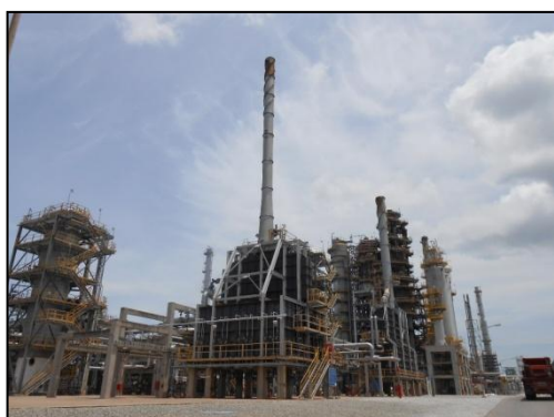
รูปที่ 3-5 HVGO Hydrotreating Unit