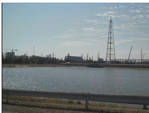
รูปที่ 3-23 บ่อน้ำดับเพลิง