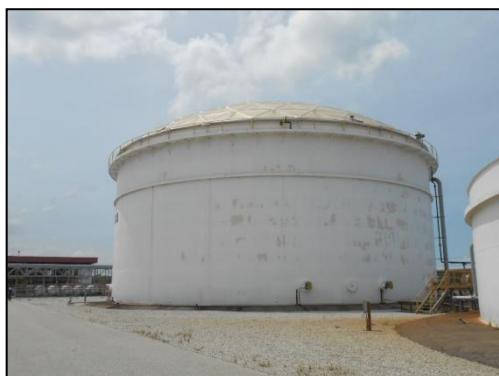
รูปที่ 3-17 ฝารอบถัง Equalization เพื่อลดกลิ่น