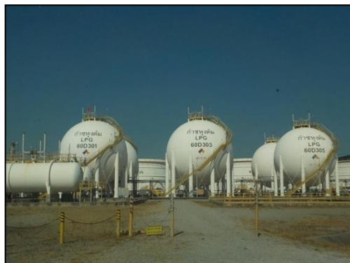
รูปที่ 3-51 ถัง LPG