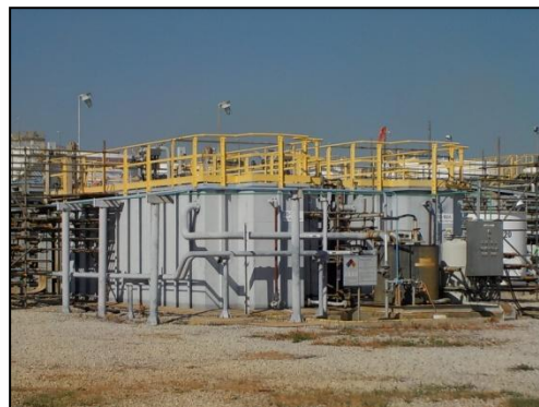
ระบบบำบัดน้ำเสียจากอาคารสำนักงาน (Sanitary System)