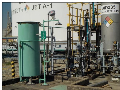
รูปที่ 3-35 ฝักบัวและอ่างล้างตาฉุกเฉิน