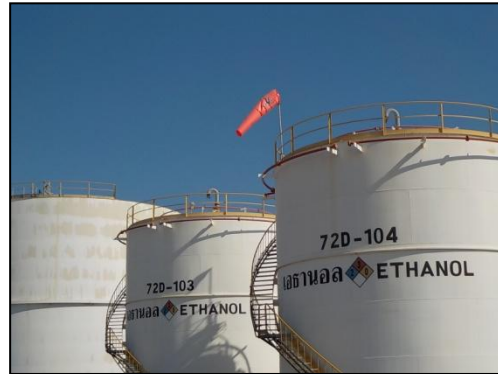
รูปที่ 3-45 Safety Valve และ Water Spray ของถังเอทานอล