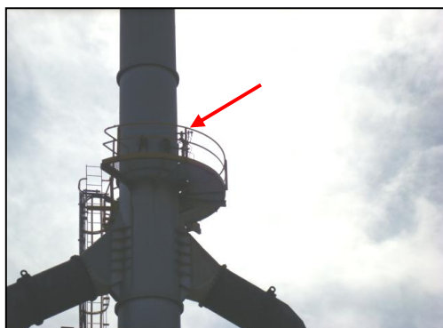
รูปที่ 3-7 Oxygen Analyzer