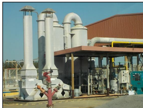
รูปที่ 3-14 Scrubber ที่ Sulfur Tank