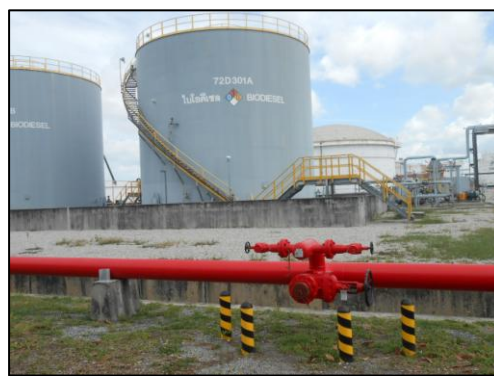
รูปที่ 3-48 อุปกรณ์ป้องกันและระงับอัคคีภัย บริเวณถัง B100