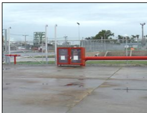
รูปที่ 3-26 อุปกรณ์ป้องกันและระงับอัคคีภัย บริเวณพื้นที่พักกากของเสีย

ภาพถ่ายประกอบการปฏิบัติตามมาตรการป้องกันและแก้ไขผลกระทบสิ่งแวดล้อม (ระยะดำเนินการ) โครงการโรงกลั่นน้ำมัน บริษัท สตาร์ ปิโตรเลียม รีไฟน์นิ่ง จำกัด (มหาชน)