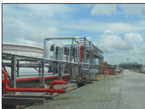
รูปที่ 3-49 Pipe Rack สำหรับท่อขนส่งน้ำมัน