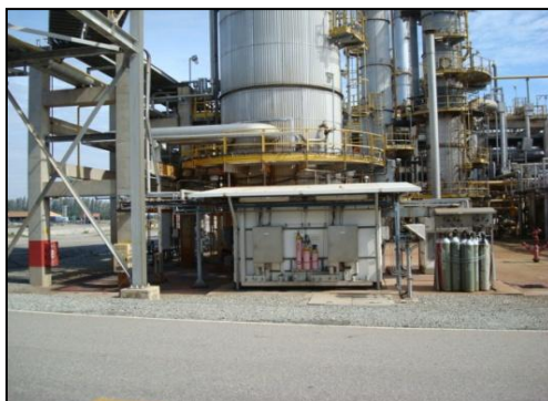
รูปที่ 3-9 CEMS ของปล่อง Tail Gas Treatment Unit