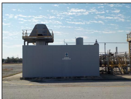
รูปที่ 3-37 Enclosure