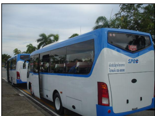
รูปที่ 3-31 รถรับ-ส่งพนักงานและคนงาน