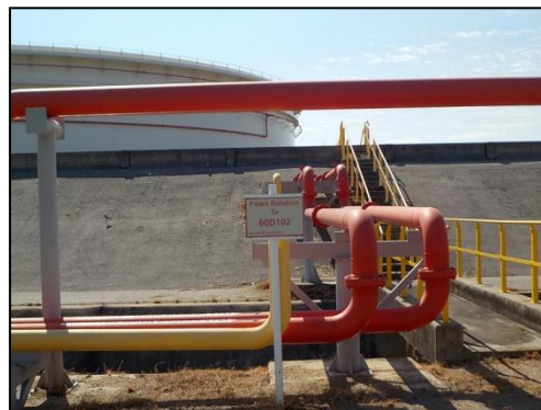
รูปที่ 3-46 ตัวอย่างอุปกรณ์ป้องกันและระงับอัคคีภัย (ต่อ)