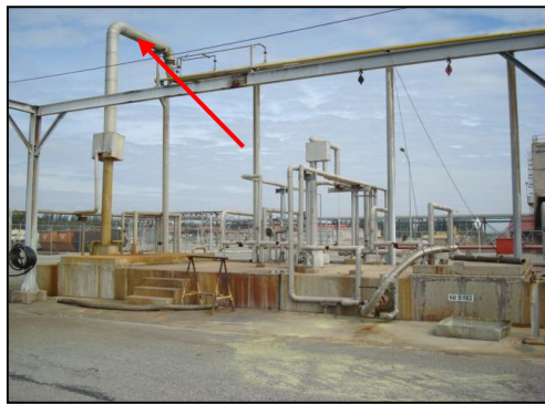
รูปที่ 3-10 ระบบตรวจอากาศจากบ่อซัลเฟอร์