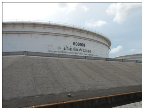
รูปที่ 3-28 คันกั้นบริเวณพื้นที่ลานถังกักเก็บ