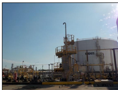
Sour Water Feed Tank