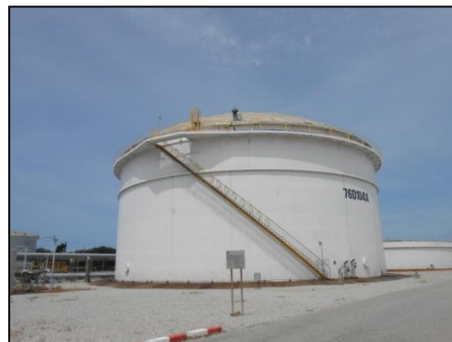
บ่อปรับสภาพน้ำเสียก่อนเข้าหน่วยเติมอากาศ (Equalization Tank)