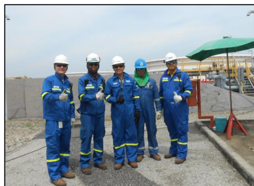
รูปที่ 3-36 พนักงานสวมใส่อุปกรณ์คุ้มครอง ความปลอดภัยส่วนบุคคล