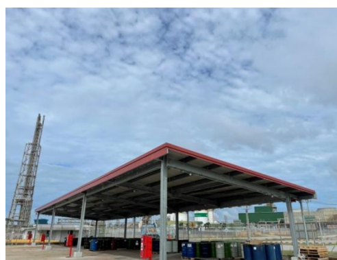
รูปที่ 3-24 พื้นที่พักกากของเสีย