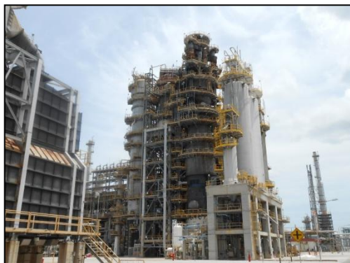
รูปที่ 3-13 DeSO x Catalyst ที่ RFCCU