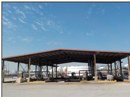
หน่วยบำบัดรวบรวมกากจุลินทรีย์ (Bio-Sludge Digester)