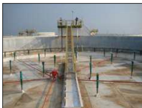
รูปที่ 3-50 ระบบกันระเหย 2 ชั้น (Double Seal) ที่ Floating Roof Tank

ภาพถ่ายประกอบการปฏิบัติตามมาตรการป้องกันและแก้ไขผลกระทบสิ่งแวดล้อม (ระยะดำเนินการ) โครงการโรงกลั่นน้ำมัน บริษัท สตาร์ ปิโตรเลียม รีไฟน์นิ่ง จำกัด (มหาชน)