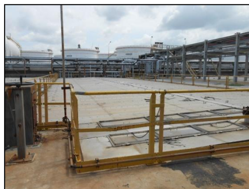
รูปที่ 3-18 ฝापิดที่ API Oil/Water Separator

ภาพถ่ายประกอบการปฏิบัติตามมาตรการป้องกันและแก้ไขผลกระทบสิ่งแวดล้อม (ระยะดำเนินการ) โครงการโรงกลั่นน้ำมัน บริษัท สตาร์ ปิโตรเลียม รีไฟน์นิ่ง จำกัด (มหาชน)