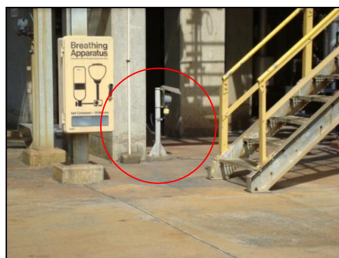
รูปที่ 3-16 H 2 S Detector