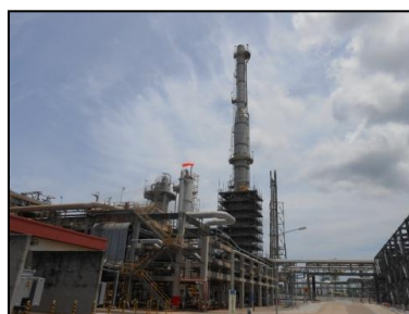
Sulfur Recovery Unit