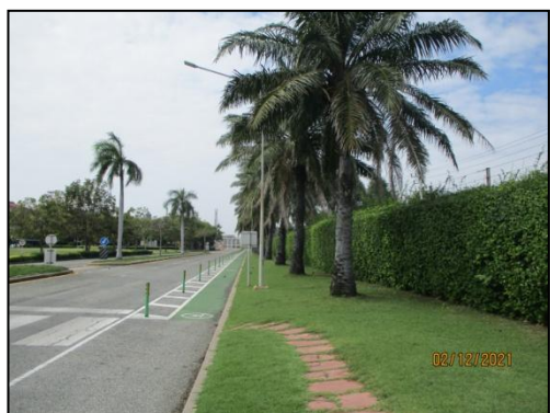
รูปที่ 3-53 พื้นที่สีเขียว

ภาพถ่ายประกอบการปฏิบัติตามมาตรการป้องกันและแก้ไขผลกระทบสิ่งแวดล้อม (ระยะดำเนินการ) โครงการโรงกลั่นน้ำมัน บริษัท สตาร์ ปิโตรเลียม รีไฟน์นิ่ง จำกัด (มหาชน)