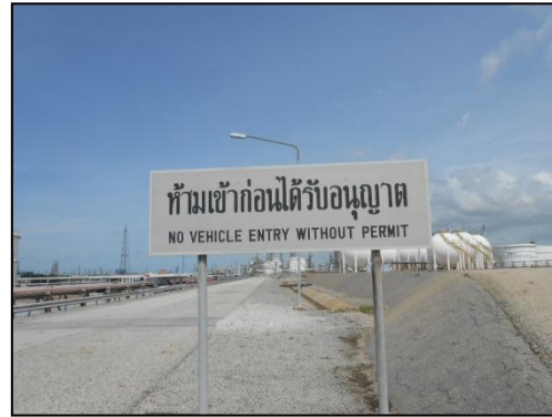
รูปที่ 3-39 ป้ายแสดงเขตพื้นที่หวงห้าม