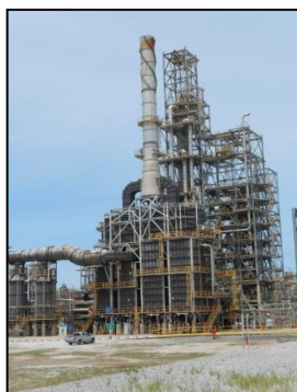
Platformer & CCR