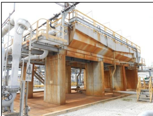
หน่วยแยกน้ำมันออกจากน้ำเสีย (Induced Air Floatation Unit)