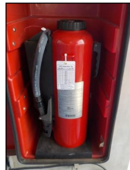
รูปที่ 3-46 ตัวอย่างอุปกรณ์ป้องกันและระงับอัคคีภัย

ภาพถ่ายประกอบการปฏิบัติตามมาตรการป้องกันและแก้ไขผลกระทบสิ่งแวดล้อม (ระยะดำเนินการ) โครงการโรงกลั่นน้ำมัน บริษัท สตาร์ ปิโตรเลียม รีไฟน์นิ่ง จำกัด (มหาชน)