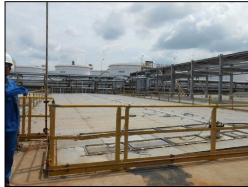
หน่วยแยกน้ำมันออกจากน้ำเสีย (API Separator Unit)