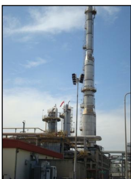
Tail Gas Recovery Unit