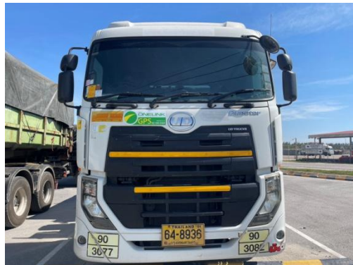
รูปที่ 3-52 การติดหมายเลขโทรศัพท์ที่รถขนส่ง