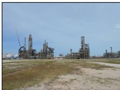
ภาพรวมของโรงกลั่นน้ำมัน