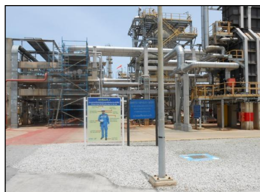
รูปที่ 3-38 ป้ายเตือนสวมใส่อุปกรณ์คุ้มครอง ความปลอดภัยส่วนบุคคล

ภาพถ่ายประกอบการปฏิบัติตามมาตรการป้องกันและแก้ไขผลกระทบสิ่งแวดล้อม (ระยะดำเนินการ) โครงการโรงกลั่นน้ำมัน บริษัท สตาร์ ปิโตรเลียม รีไฟน์นิ่ง จำกัด (มหาชน)