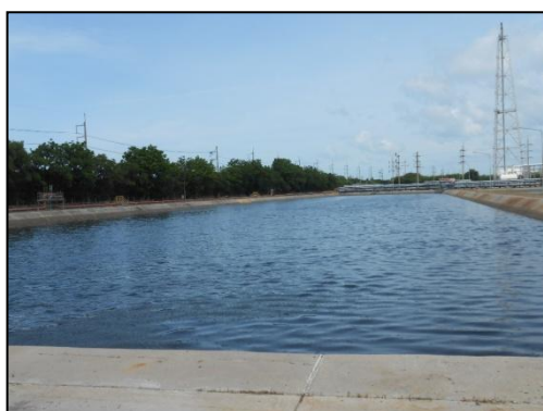
บ่อพักน้ำเสียที่ผ่านการบำบัดแล้ว (Polishing Pond)