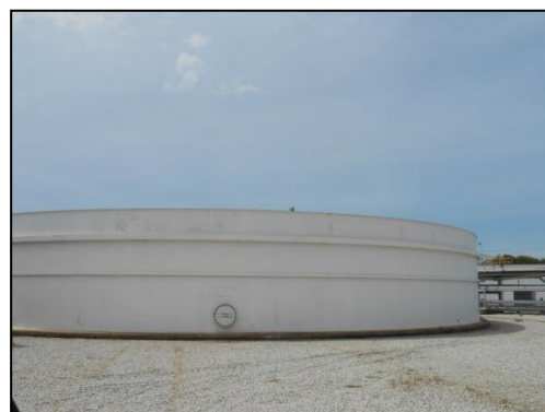
บ่อดกตะกอน (Bioreactor Clarifier)