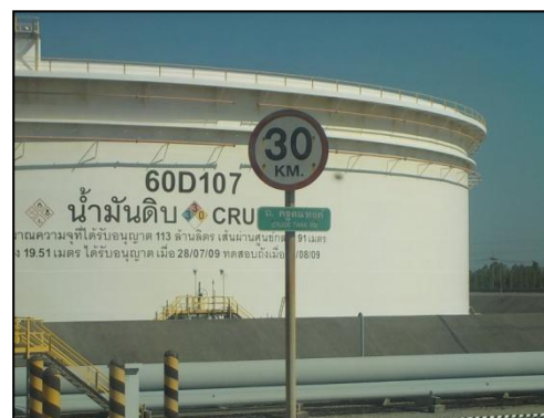
รูปที่ 3-30 ป้ายจำกัดความเร็ว บริเวณกระบวนการผลิต