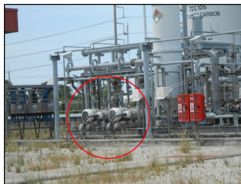
รูปที่ 3-21 Pump/Blower ของ VRU

ภาพถ่ายประกอบการปฏิบัติตามมาตรการป้องกันและแก้ไขผลกระทบสิ่งแวดล้อม (ระยะดำเนินการ) โครงการโรงกลั่นน้ำมัน บริษัท สตาร์ ปิโตรเลียม รีไฟน์นิ่ง จำกัด (มหาชน)