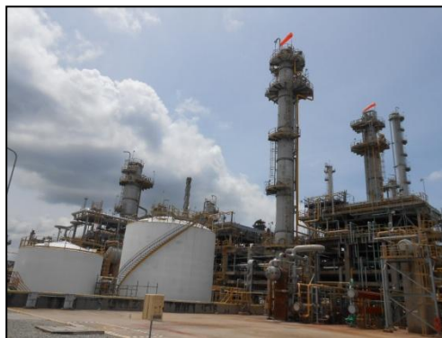
รูปที่ 3-4 Sour Water Stripping Unit