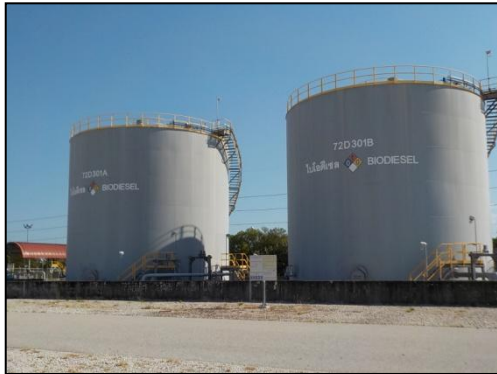
รูปที่ 3-44 คั่นกันของถัง B100