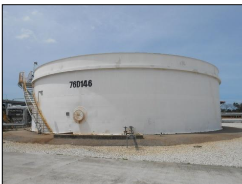
บ่อเติมอากาศ (Bioreactor Tank)