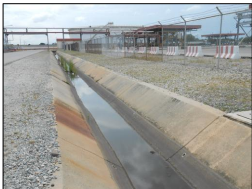
รูปที่ 3-27 รางระบายน้ำฝนแบบเปิด