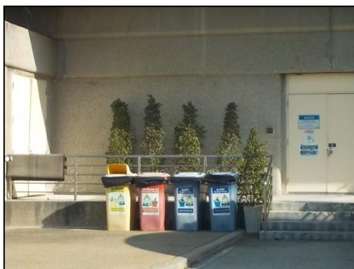
รูปที่ 3-25 ภาชนะบรรจุกากของเสียแยกประเภท