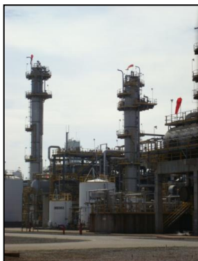
รูปที่ 3-3 Amine Regeneration Unit