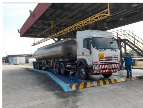
รูปที่ 3-47 สถานีสูบน้ำทางรถ