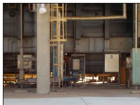
รูปที่ 3-8 CEMS ของปล่อง RFCCU

ภาพถ่ายประกอบการปฏิบัติตามมาตรการป้องกันและแก้ไขผลกระทบสิ่งแวดล้อม (ระยะดำเนินการ) โครงการโรงกลั่นน้ำมัน บริษัท สตาร์ ปิโตรเลียม รีไฟน์นิ่ง จำกัด (มหาชน)